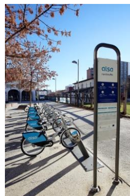
ESTACIÓN DE PRÉSTAMO DE BICICLETAS