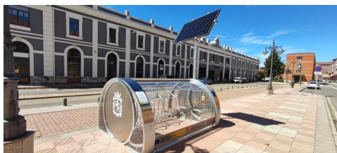
APARCAMIENTO SEGURO PARA BICICLETAS Y VMP